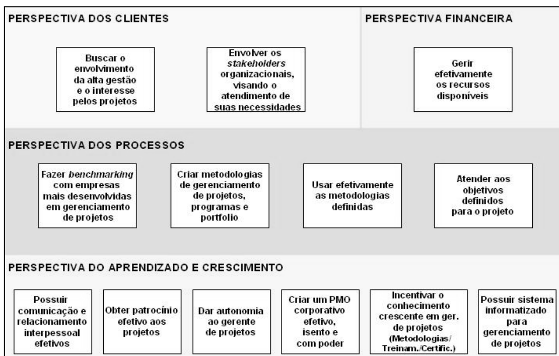
Figura 2 – Mapa estratégico sob a perspectiva dos fatores críticos identificados.

Dessa forma, partiu-se para a organização dos 13 fatores críticos para a maturidade em GP identificados (Seção 4.1) dentro das quatro perspectivas originais do BSC, o que foi realizado respeitando as características de cada perspectiva. Nesse contexto, os fatores críticos ficaram caracterizados como objetivos estratégicos no mapa estratégico proposto, respeitando a correta nomenclatura sugerida a partir do referencial teórico. Assim, o mapa estratégico ficou da seguinte forma (Figura 2).